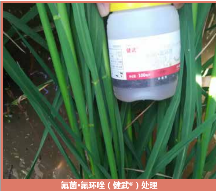
氟菌·氟环唑 (健武®) 处理