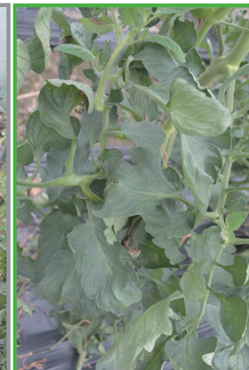
氯氟醚·吡唑啉酯（锐收果香） 1800倍