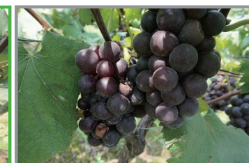
进口脲菌酯+戊唑醇 3000倍