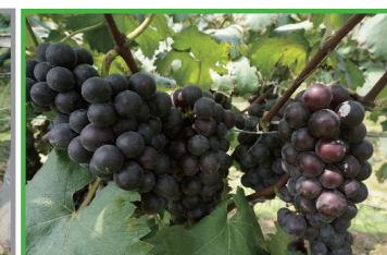
氯氟醚·吡唑啉酯（锐收果香） 2000倍