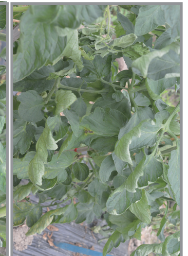
进口脲菌酯+氟吡菌酰胺 1800倍