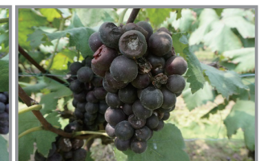
进口脲菌酯+茶醚甲环唑 1500倍