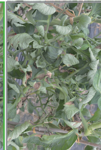
进口脲菌酯+戊唑醇 3000倍